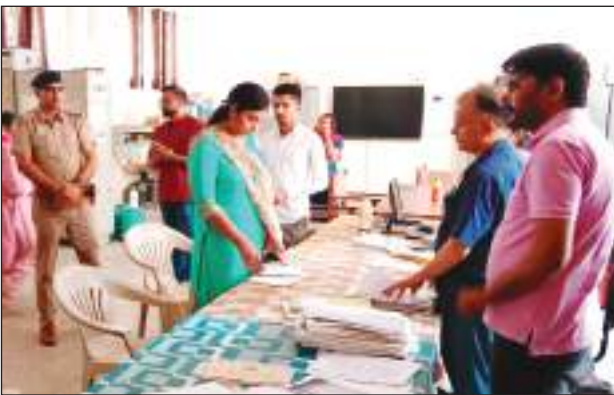
जो जहां सुपरिटेण्डेंट नदारद मिले। इसके बाद एसडीएम तहसील पहुंची तो वहां तहसील में भी नायब तहसीलदार सहित अन्य अधिकारी

टीएम एक्शन इंडिया/गन्नीर सोमवार को लघु सचिवालय में स्थित सभी कार्यालय का एसडीएम डा. अनुपमा मलिक ने औचक निरीक्षण किया। इस दौरान लगभग सभी विभागों में अधिकारी और कर्मचारी नदारद मिले। अधिकारियों व कर्मचारियों के गैरहाजिर मिलने पर एसडीएम ने जहां सभी को कारण बताओ नोटिस जारी किया तो वहीं 1 दिन का वेतन काटने के भी आदेश जारी किए। एसडीएम डा. अनुपमा मलिक ने अपने औचक निरीक्षण की शुरूआत सबसे पहले अपने कार्यालय से