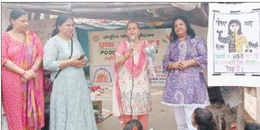
टीम एक्शन इंडिया/नई दिल्ली ज्ञान आधार वेलफेयर सोसायटी के द्वारा शालीमार बाग और पीतामपुरा

के पास सीए ब्लॉक के स्लम इलाकों में मदर्स डे और पोषण माह मनाया। बच्चों में कुपोषण के